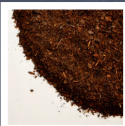
Pinie 0-7 mm